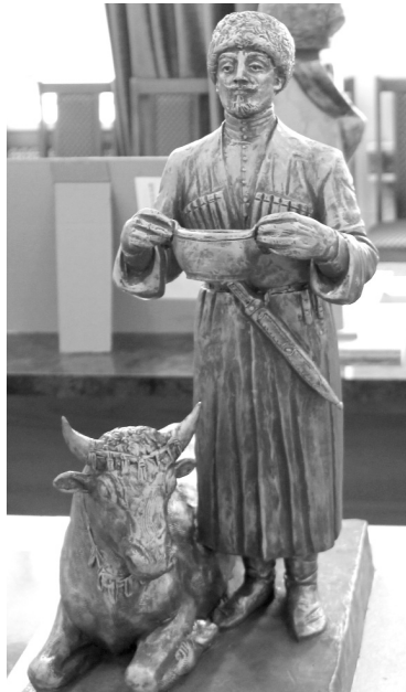
Куыд загътам, афтæмæй Ирыхъæуы цæрджытæ фæлтæрæй-фæлтæрмæ нæ рох кæнынц Пипойы рухс ном. Уымæ гæсгæ хъæубæсты æхсæнады минæ-

Фæстæдæр Ирыхъæуы цæрджытæ кувæндон сарæзтой ацы бынаты æмæ абын онг дæр куывынд Хуыцауы дзуармæ. Адам æй хоньнд Пипойы дзуар, кæнæ — Ирыхъæуы дзуар, арæхдæр та йæ комкоммæ нысануæгмæ гæсгæ — Хуыцауы дзуар. Уый ис Ирыхъæуы хуссар-ныгуылæйнаг кæронæй дыууæ километры уæлдæр цæугæдон Терчы рахизфарс.